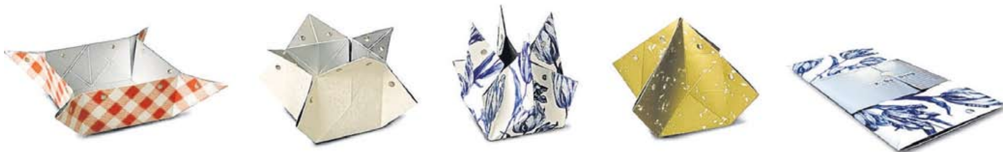
Het K'do ding is er in allerlei prints.