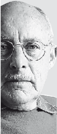
ROMKE VAN DE KAA

Prunus serrula wordt niet hoger dan een meter of acht en is daardoor geschikt voor kleine en middelgrote tuinen. Meestal wordt van een boom verlangd dat hij één rechte stam maakt, maar bij bomen die om hun decoratieve schors worden aangeplant ligt het voor de hand om ze meerstammig op te laten groeien. Dat kan door de boom direct na het planten tot de grond toe terug te snoeien.